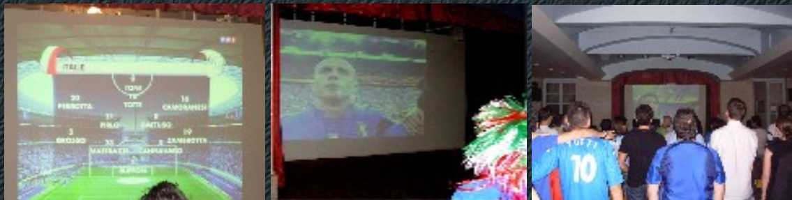
Présentation de la squadra Azzurri et l'hymne de Mameli.