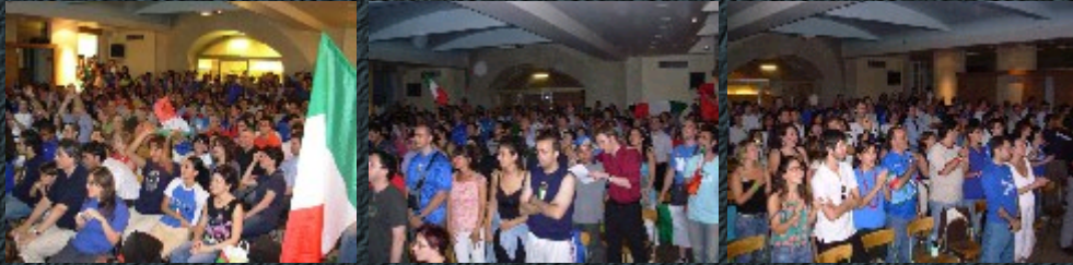
Avant la finale du Mondial 2006 Italia-France à la Mission.