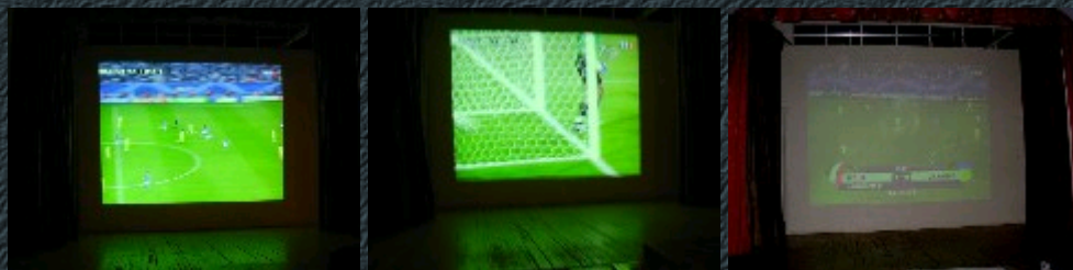
Phase de jeu et le but égalisateur de Materazzi.